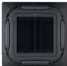
Panel decorativo negro