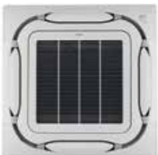
Panel decorativo blanco