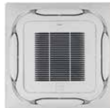
Panel decorativo autolimpiante