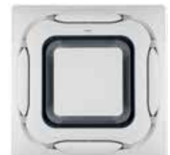
Panel decorativo diseño integrado